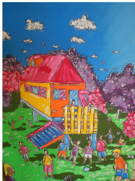
LA CABANE DES GAMINS